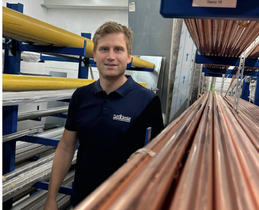
Das Team der TLM Transfer-Leitungs-Montagen GmbH